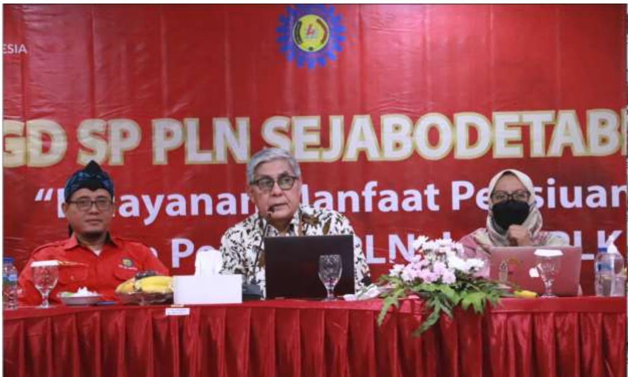
Saat diskusi dan tanya jawab.