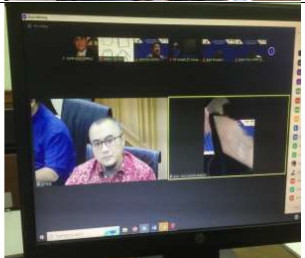
Beberapa Komitmen Dukungan Penerapan SMAP – ISO 37001 Th.2016 oleh Mitra Kerja DP-PLN