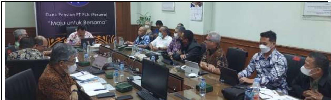
Paparan Rencana Kerja 2023 oleh Direksi APLN (09 Nop 2022)

Dalam paparannya, AGP mencanangkan pertumbuhan pendapatan RKAP 2023 naik 17% dari RKAP 2022 dan Laba Bersih dipatok naik lebih dari 11 %.