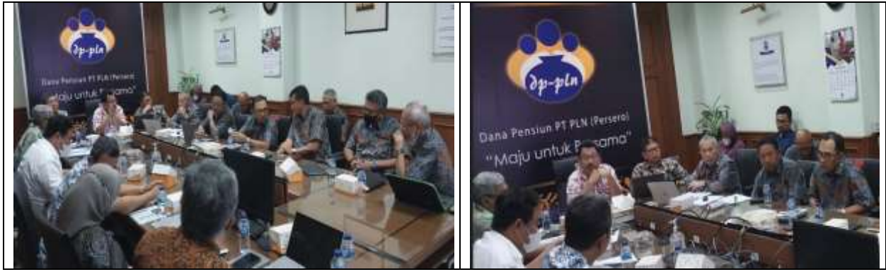
Paparan Rencana Kerja 2023 oleh Direksi AGP (09 Nop 2022).

Dalam paparannya, AGP mencanangkan pertumbuhan pendapatan RKAP 2023 naik 17% dari RKAP 2022 dan Laba Bersih dipatok naik lebih dari 11 %.