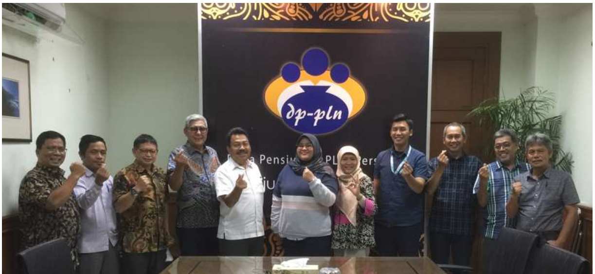
Closing Audit Eksternal Tahap II oleh Sucofindo – Selasa, 20 Desember 2022

Jakarta, Desember 2022 DP-PLN. Id/211222