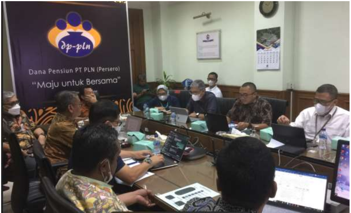
RAPAT TINJAUAN MANAJEMEN – RABU 7 DESEMBER 2022