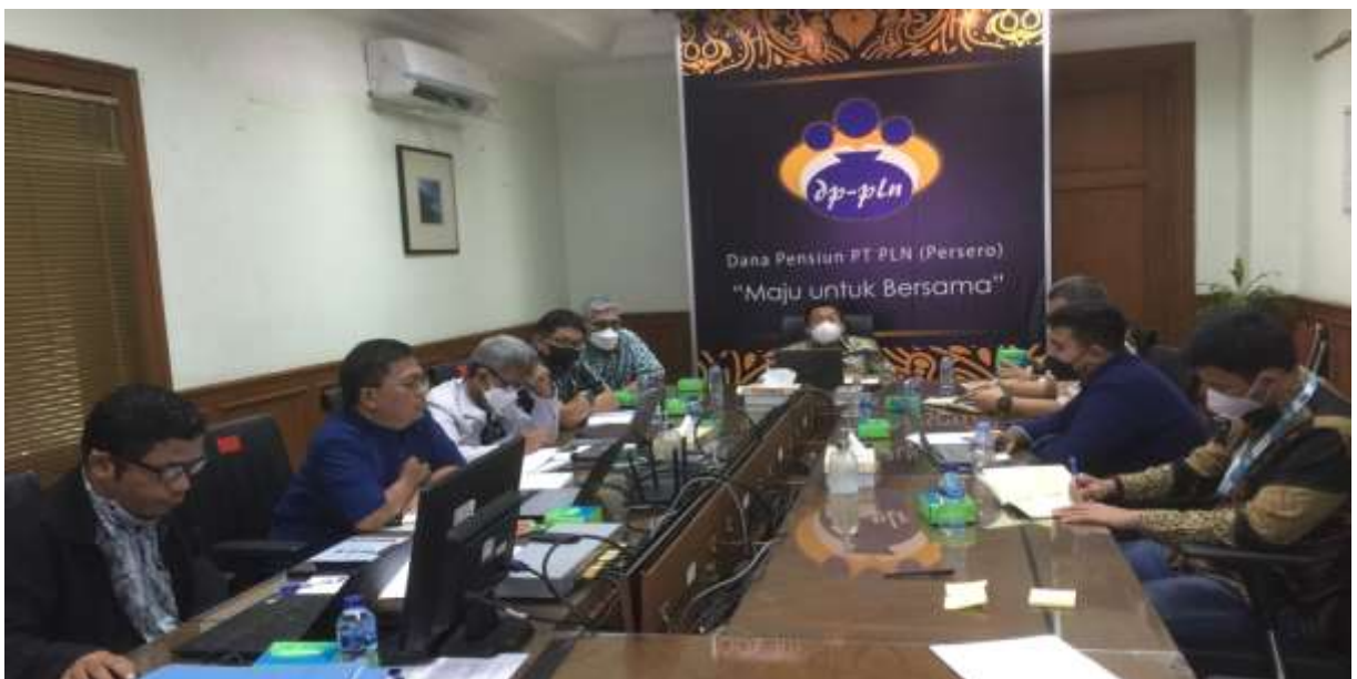
Proses Audit Eksternal Tahap I oleh Sucofindo – Jumat, 9 Desember 2022