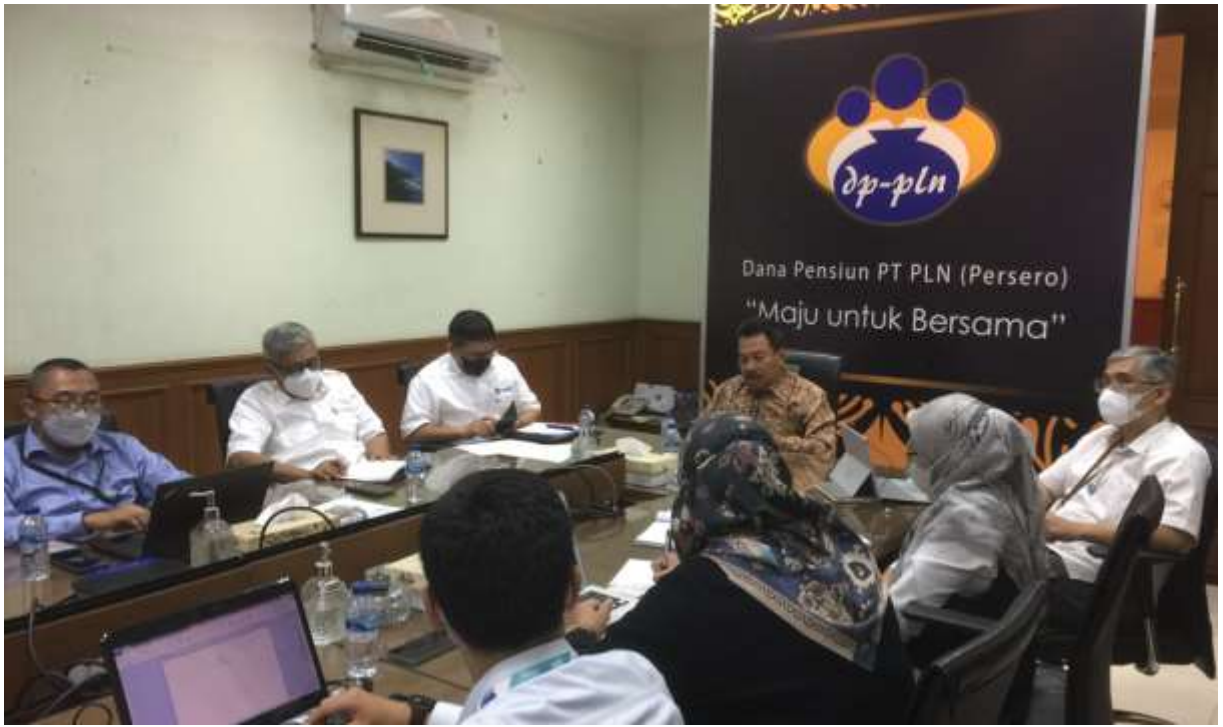
Proses Audit Eksternal Tahap II oleh Sucofindo – Senin, 19 Desember 2022